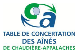
Table de concertation des aînés de Chaudière-Appalaches 5501, rue Saint-Georges, Lévis (Québec) G6V 4M7

Prochaine livraison du bulletin 15 mai 2026 date de tombée 8 mai 2026.