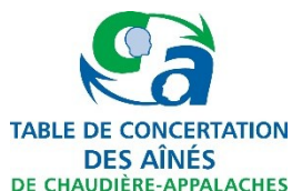
Table de concertation des aînés de Chaudière-Appalaches 5501, rue Saint-Georges, Lévis (Québec) G6V 4M7

Prochaine livraison du bulletin 15 juin 2025, date de tombée 9 juin.