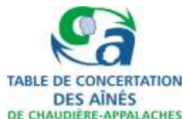
Table de concertation des aînés de Chaudière-Appalaches 5501, rue Saint-Georges, Lévis (Québec) G6V 4M7

Prochaine livraison du bulletin 15 septembre. Date de tombée 8 septembre 2024