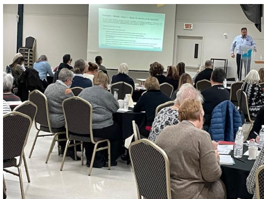
Présentation sur le transport