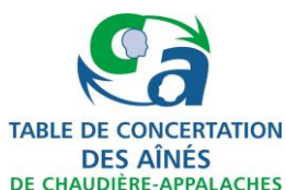
Table de concertation des aînés de Chaudière-Appalaches 5501, rue Saint-Georges, Lévis (Québec) G6V 4M7

Production et diffusion : Maurice Grégoire; correction : Édith Dumont.