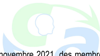
TABLE DE CONCERTATION DES AÎNÉS

N.B. Ces recommandations sont détaillées à la page 14.