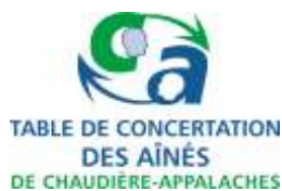
Table de concertation des aînés de Chaudière-Appalaches 5501, rue Saint-Georges, Lévis (Québec) G6V 4M7

Production : Maurice Grégoire; correction et diffusion : Martine Lessard.