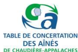
Table de concertation des aînés de Chaudière-Appalaches 5501, rue Saint-Georges, Lévis (Québec) G6V 4M7

Production : Maurice Grégoire; correction et diffusion : Martine Lessard.